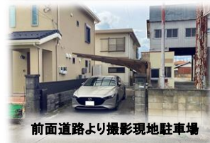
前面道路より撮影現地駐車場