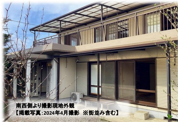
南西側より撮影現地外観 【掲載写真:2024年4月撮影 ※街並み含む】