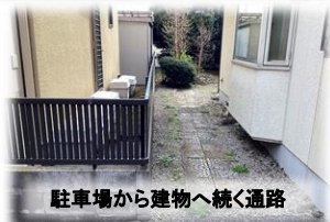
駐車場から建物へ続く通路